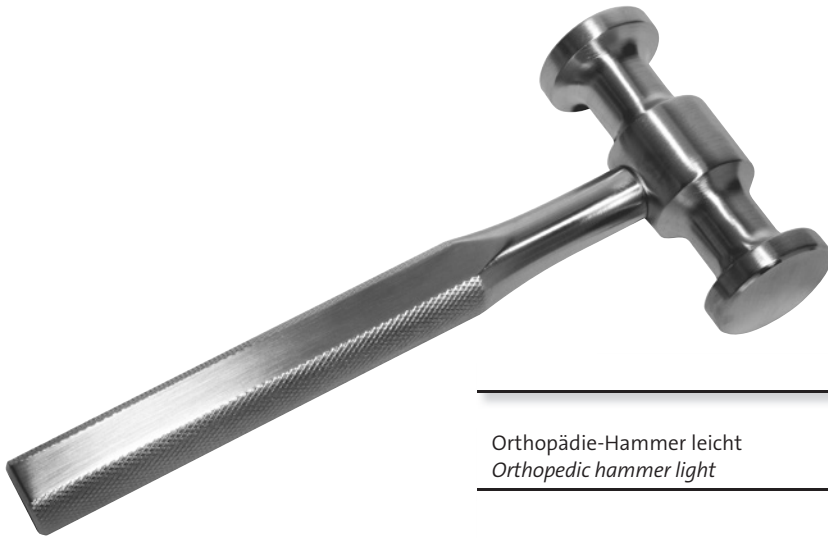
Orthopädie-Hammer leicht Orthopedic hammer light