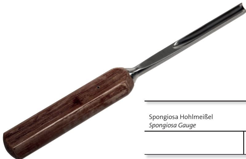
Spongiosa Hohlmeißel Spongiosa Gauge