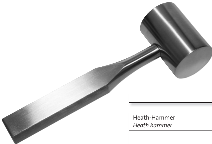
Heath-Hammer Heath hammer